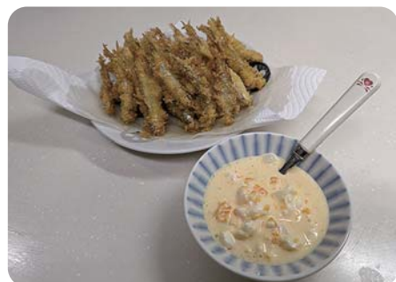
ワカサギフライ ～自家製タルタルソースを添えて