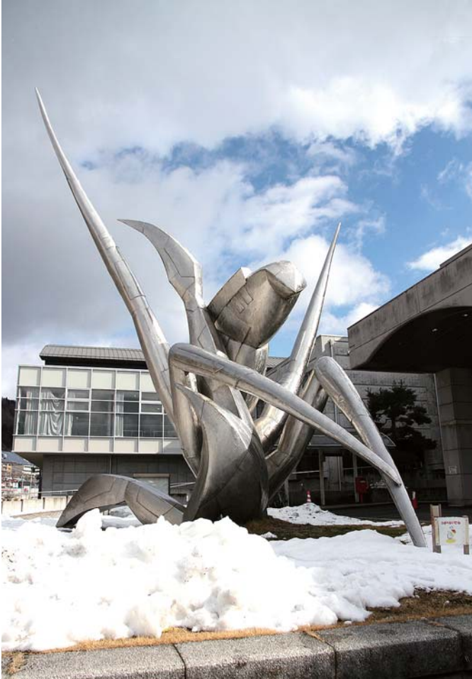
中嶋 大道ノ作 1998年制作 信州新町支所 令和6年2月撮影

前回に引き続き、市町村合併により長野市となった地区にある旧合併町村が設置した野外彫刻をご紹介します。今回は信州新町支所にある「躍動」です。