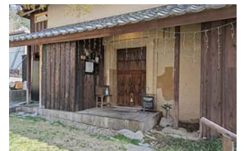
kitchen土野庫（店舗入り口）

さて、ちょうどお昼過ぎの時間になり、お楽しみのお昼食です。何処に行きましょかとあれこれ話をして、前からFacebookで知っていたkitchen土野庫が近くにある事を思い出して、そこに決めました。