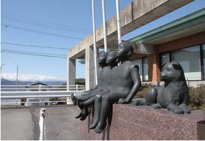
峯田 義郎／作 1991年制作 大岡支所 令和6年4月撮影

5月号も引き続き、市町村合併により長野市となった地区にある旧合併町村が設置した野外彫刻をご紹介します。今回は大岡支所にある「やまなみ」です。