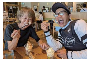
▲花の駅 千曲川りんごサイダーフロート