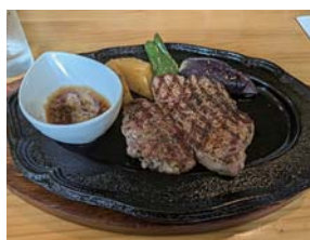
ヒレスステーキ レギュラー130g

後半戦の出発です。急坂、急カーブの難所（ルートミスしてしまつてごめんなさい）を乗り越え野沢温泉スポーツ公園で集合写真を撮影し、道の駅 花の駅千曲川でお土産を購入し、休憩をとってからパティスリーヒラノで再度、お土産を購入し、国道117号線を南下し流れ解散となりました。