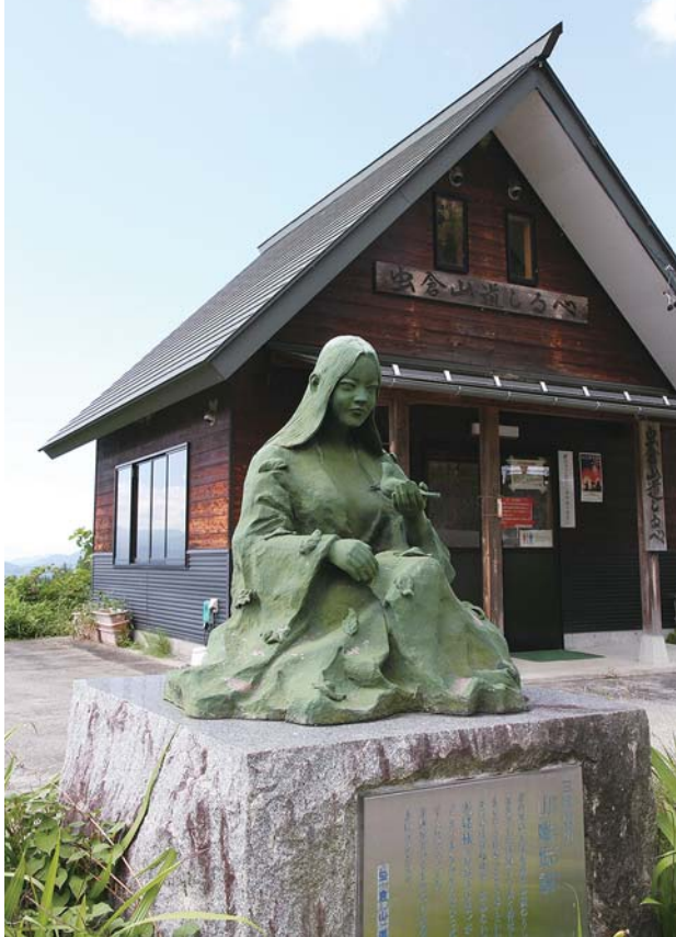
虫倉山観光案内所／虫倉山道しるべ