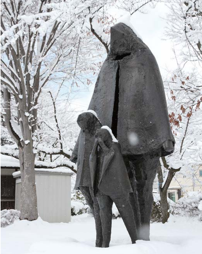
平成元年 第17回長野市野外彫刻賞 二〇 金一ノ作 辰巳公園 令和7年2月撮影

母親と男の子と女の子がマントを着て雪の道を歩いている像です。寒い北の国ですが、母親の逞しい生活力あふれた内面がデフォルメされた大きな体と顔に表現されています。その母親を信じきって寒さに負けないような凛々しい男の子と、手袋をはめた手に息を吹き掛けて寒気をやわらげようとしている女の子のあどけなさが表れています。北国の厳しい冬を逞しく生きていこうとする気力あふれる姿は感動的でもあります。